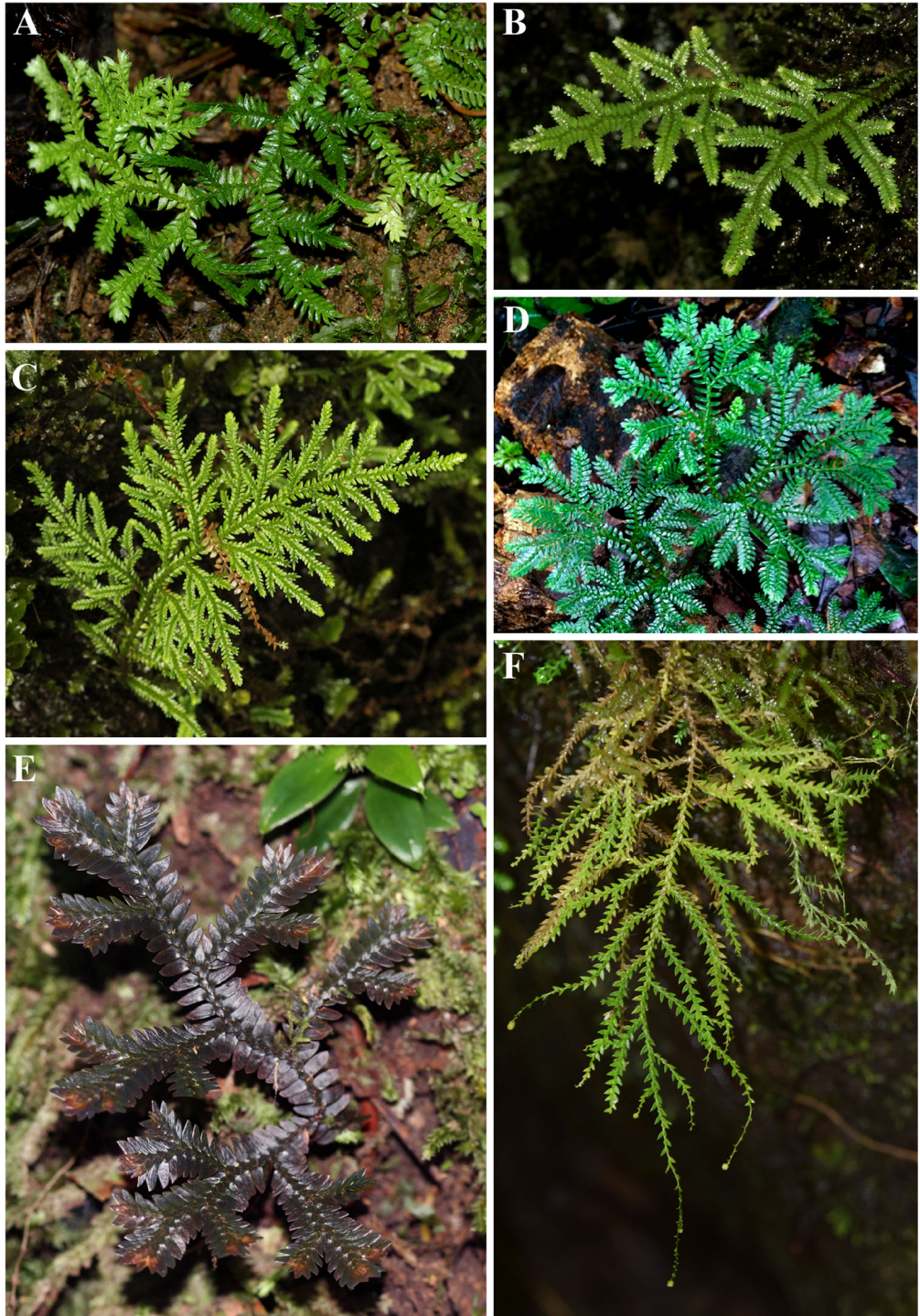
FIG. 5. Fotos de campo de distintas especies de Selaginella presentes en el departamento de Antioquia, Colombia. A. S. muscosa (S. Vega-Betancur 107, HUA) B. S. novae-hollandiae planta juvenil (S. Vega-Betancur 67, HUA) C. S. novae-hollandiae (S. Vega-Betancur 67, HUA) D. S. silvestris (S. Vega-Betancur 12, HUA) E. S. producta (S. Vega-Betancur 567, HUA) F. S. porphyrospora (S. Vega-Betancur 697, HUA). Fotos A-E: S. Vega-Betancur, F: M. Sundue.