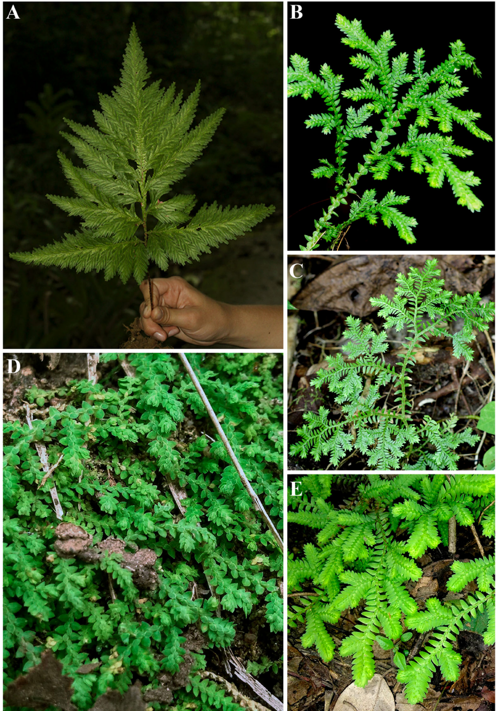
FIG. 4. Fotos de campo de distintas especies de Selaginella presentes en el departamento de Antioquia, Colombia. A. S. haematodes (S. Vega-Betancur 54, HUA) B. S. horizontalis (S. Vega-Betancur 2, HUA). C. S. kunzeana (S. Vega-Betancur 88, HUA) D. S. microphylla (S. Vega-Betancur 43, HUA). E. S. microtus (S. Vega-Betancur 41, HUA).