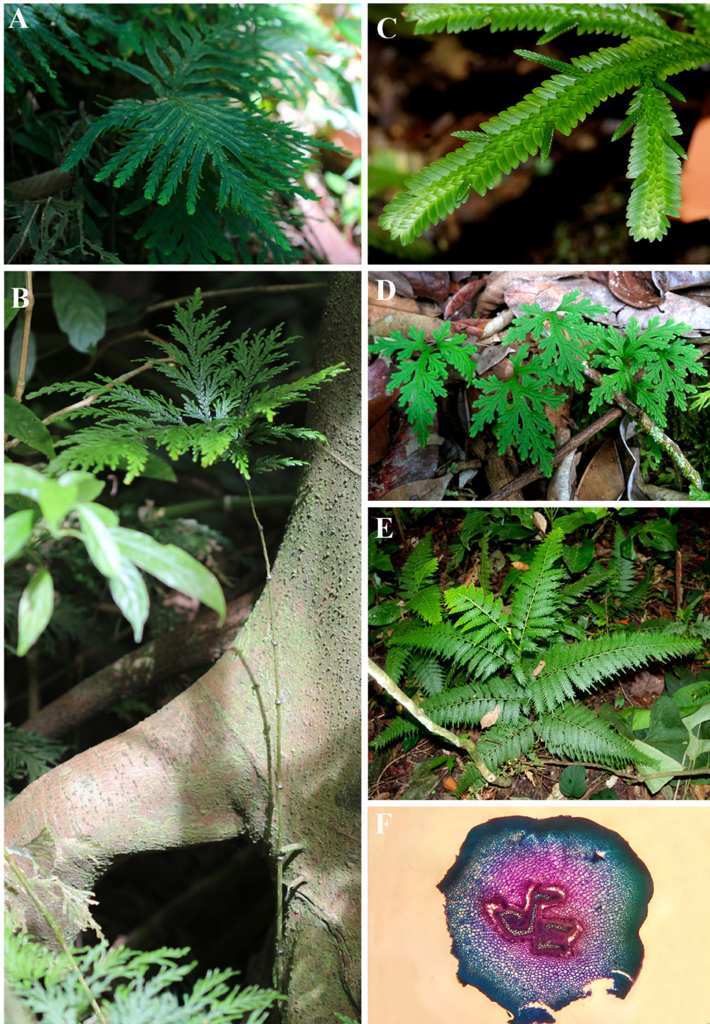
FIG. 3. Fotos de campo y microscopio de distintas especies de Selaginella presentes en el departamento de Antioquia, Colombia. A. S. bombycina (S. Vega-Betancur 100, HUA). B. S. geniculata detalle del hábito erecto y el tallo articulado (S. Vega-Betancur 17, HUA). C. S. chrysoleuca detalle de los estróbilos laterales (S. Vega-Betancur 8, HUA). D. S. erythropus (S. Vega-Betancur 22, HUA). E. S. exaltata detalle del hábito erecto (S. Vega-Betancur 4, HUA) F. Corte transversal del eje principal de S. exaltata detalle de la actinoplectostela.